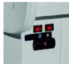
Panneau de commande avec thermostat.