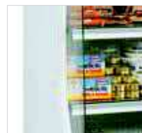
Côtés avec une partie en verre pour une meilleure vision.