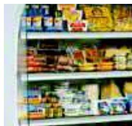
Étagères réglables en hauteur.