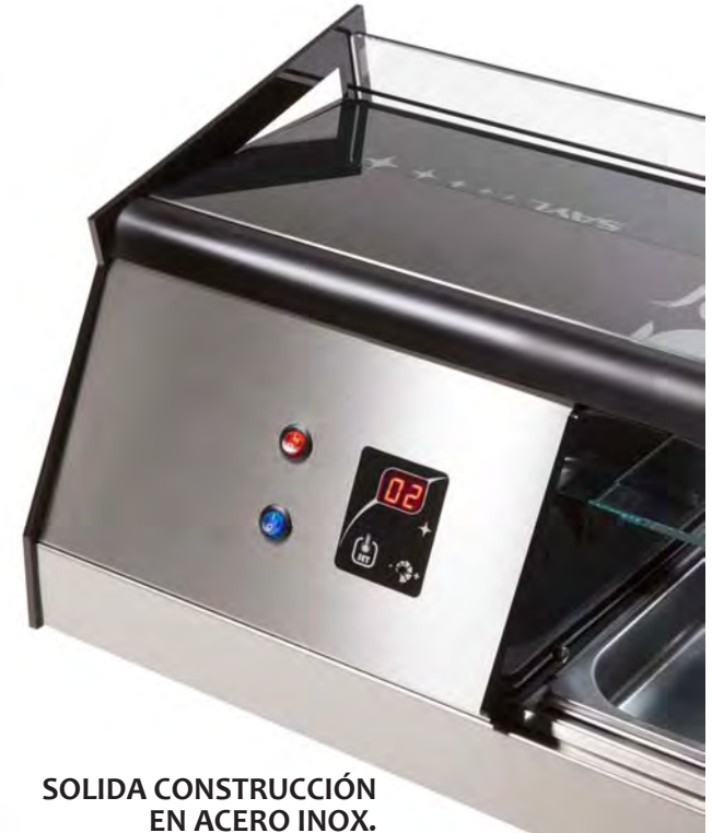
SOLIDA CONSTRUCCIÓN EN ACERO INOX. SOLID STAIN STEEL CONSTRUCCION