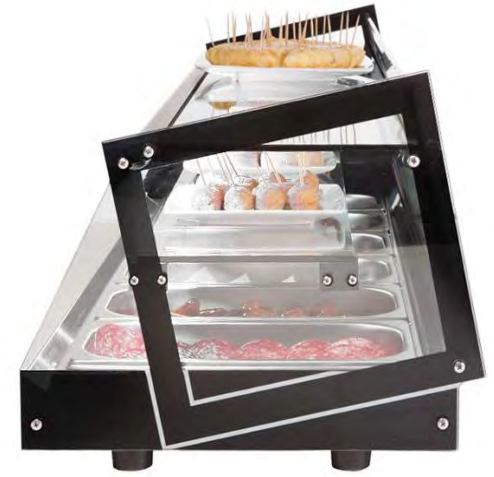
ESPECTACULAR DISEÑO CUBE SPECTACULAR "CUBE" DESIGN