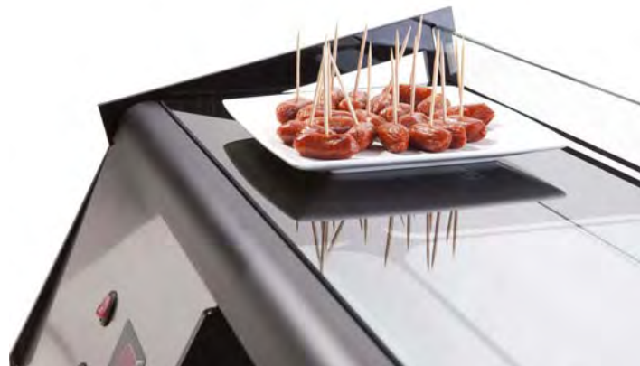
ESTANTE SUPERIOR PROTEGIDO DE GOLPES UPPER SHELF STRIKES PROTECTED