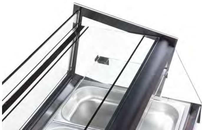
DOBLE ESTANTE DE CRISTAL TEMPLADO DOUBLE TEMPERED GLASS SHELF