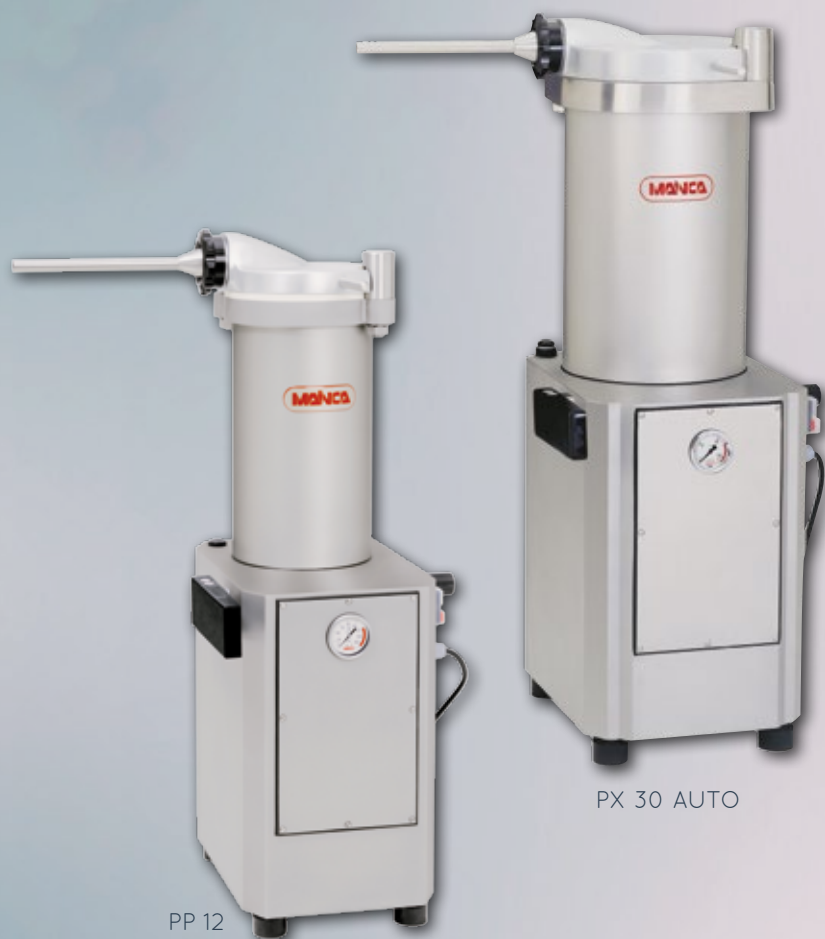
PX 30 AUTO