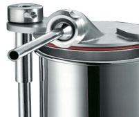
Optional s/s bush, optional