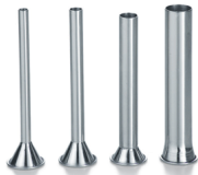
Funnels in s/s ø 13-16-20-38 optional