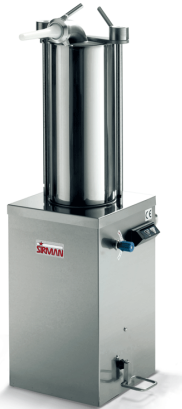
Sirman Pousoirs , modèle IS 15 Idra :

Sirman Spa Viale dell'Industria 9/11 35010 PIEVE DI CURTAROLO (PD), Italy Tel./Fax. +39 049 9698666 / +39 049 9698688 email: info@sirman.com