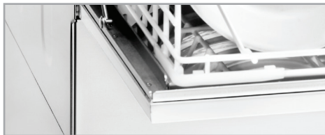
Porte double paroi

Stainless steel washing and rinsing arms