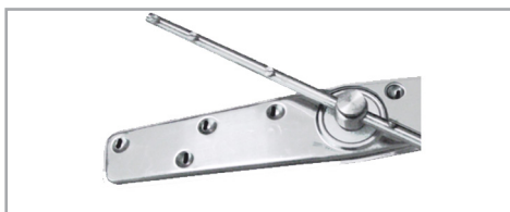
Bras de lavage et de rinçage en inox Stainless steel washing and rinsing arms