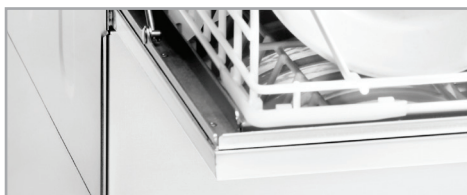
Porte double paroi Double skinned door