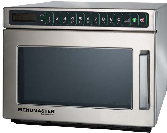
Modèle DEC18E2 illustré